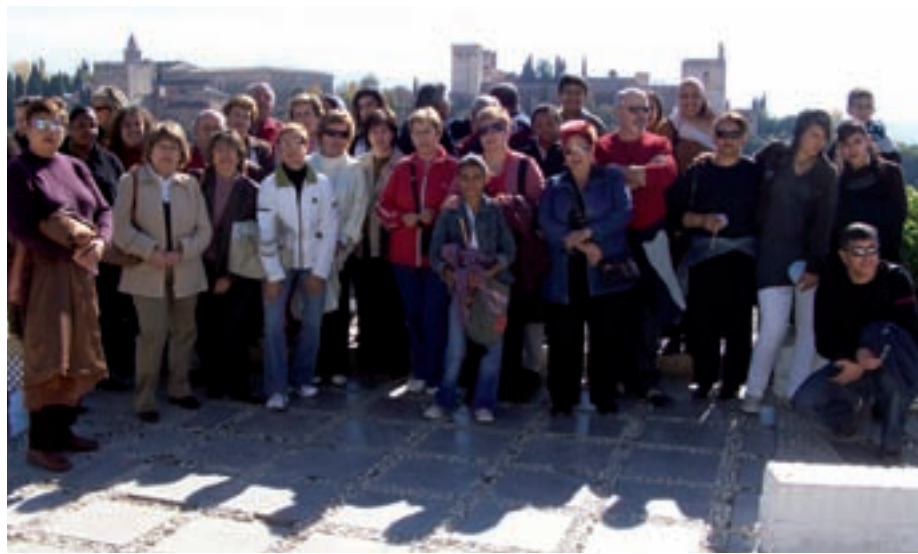
En visite à l'Alhambra...

A l'ordre du jour les mêmes préoccupations que celles à Aix : les politiques espagnoles de promotion des femmes, les politiques d'insertion "par l'économique" et les structures qui les portent, le fonctionnement des associations espagnoles, leurs relations avec les services de la Ville de Grenade. L'association culturelle La Noria,