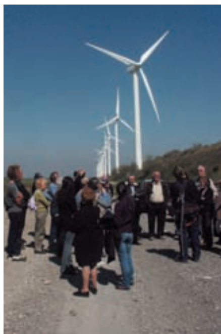
Sortie sur un site d'éoliennes organisée par la MNE

Le Centre Permanent d'Initiatives pour l'Environnement a, lui, une action de terrain entièrement dédiée au Pays d'Aix. Créé en 1997 pour mettre en œuvre la