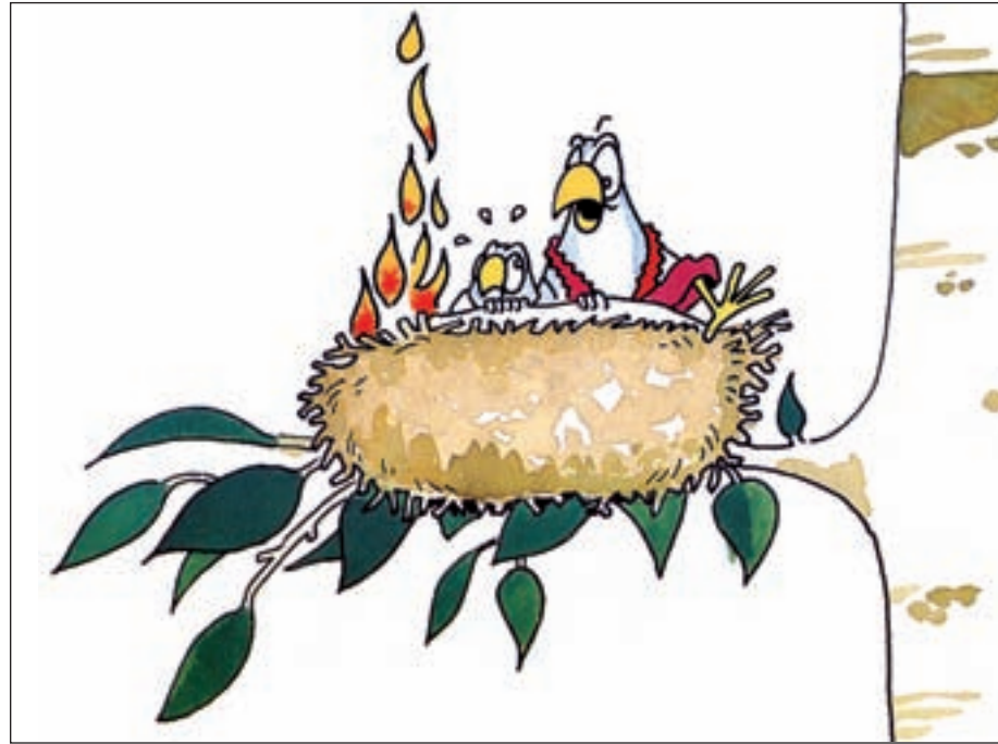
Les animaux malades du tabac : "ça devait arriver depuis le temps que Monsieur fume au nid" Illustration : Delestre

Mais il faut regarder les choses en face : qui aujourd'hui fume dans une voiture avec des enfants à bord, comme cela aurait semblé naturel à des parents dans les années soixante-dix ? Qui aujourd'hui trouve anormal de ne pas fumer dans un avion, même long-courrier ? La fin du tabac dans les lieux publics parachève en réalité l'évolution de la société en général vis-à-vis de la cigarette, amorcée depuis plus de trente ans. Il y a fort à parier que dans quelques mois c'est la situation actuelle qui apparaîtra comme naturelle, comme elle l'est chez la plupart de nos voisins européens, même ceux que les Français pensent encore moins disciplinés qu'eux, les Italiens.