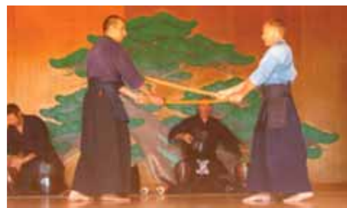
Démonstration de Kendo au Théâtre Nô d'Aix en Provence

Maison du Japon en Méditerranée Maison des Associations 1, Rue Emile Tavan 13100 Aix-en-Provence Tél. 04 42 612 777