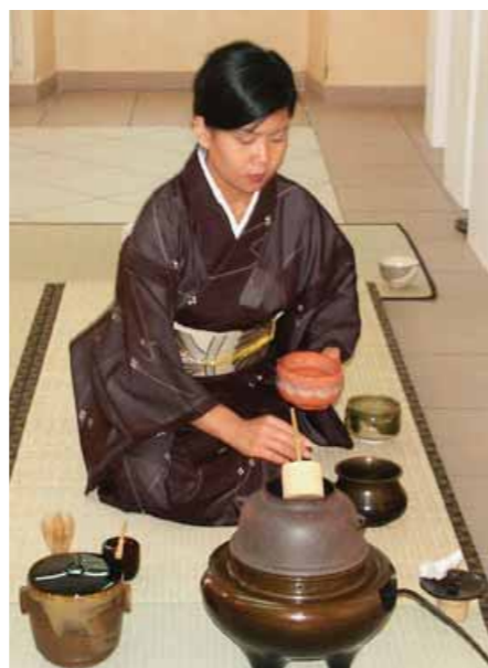
Cérémonie du Thé

découvrir toutes les associations du Pays d'Aix qui ont tissé des liens avec le Japon. Car elles sont nombreuses aujourd'hui à travailler à la promotion des échanges entre nos deux pays et à la découverte de la culture japonaise. Chasen (Cérémonie du thé), le Théâtre Nô-Maître Kano ou encore l'Ikebana