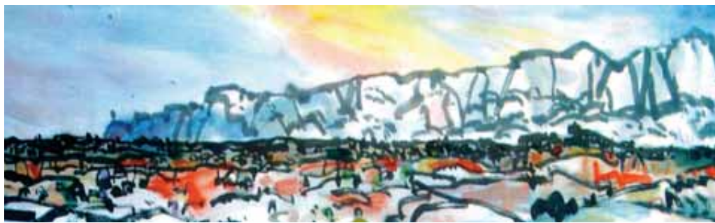
“La Sainte-Victoire” de Shoichi Hasegawa - Aquarelle sur papier (100x35)