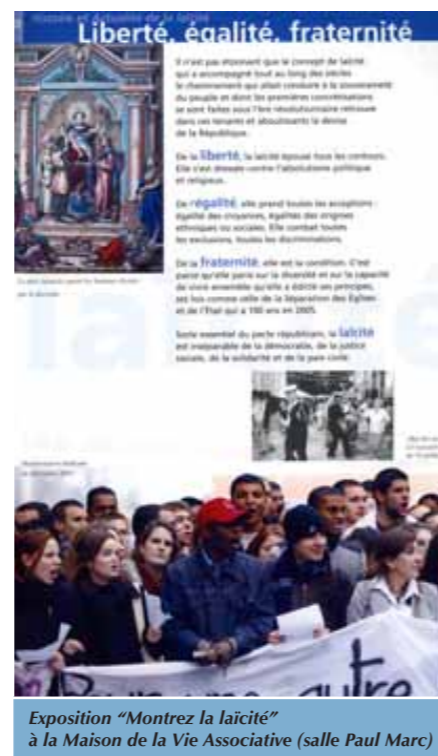
Exposition "Montrez la laïcité" à la Maison de la Vie Associative (salle Paul Marc)

Ligue des Droits de l'Homme Adresse : Maison de la Vie Associative Le Ligourès - Place Romée de Villeneuve 13090 Aix en Provence Tél. 04 42 17 97 03 - 06 65 70 17 26 ldh.aix@laposte.net