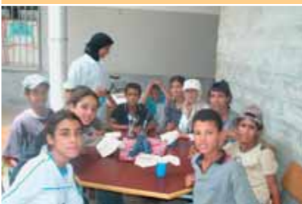
Colonie de vacances

Faute de moyens, l'association ne peut bien entendu pas recruter du personnel salarié et compétent. L'ensemble de ses missions repose donc uniquement sur l'implication et l'envie d'aider ces jeunes bénévoles. Des résultats et une solidarité qui méritent tout notre respect. ■