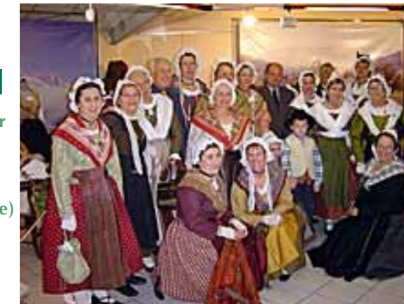
Les Mireilles d'Or