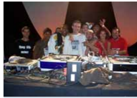
Listen to the music ! et autres...