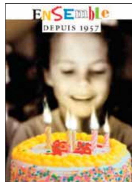
Célébrons le 50 e anniversaire du Traité de Rome

C'est depuis 1985 un rendez-vous incontournable. La Journée de l'Europe, fêtée dans toute l'Union, est l'occasion chaque année de revisiter notre histoire et comprendre une institution encore trop souvent ignorée. Plus particulièrement cette année, le 9 mai s'inscrit pleinement dans le thème adopté par les 25 (pardon les 28 !) pour 2007 : la non-discrimination et l'égalité des chances pour tous.