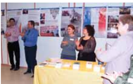
Exposition "Montrez la laïcité" proposée par l'Observatoire de la Laïcité du Pays d'Aix

La Loi relative au contrat d'association, dite de 1901 est contemporaine de la Loi, dite de 1905, concernant la séparation des Églises et de l'État. Il n'y a là aucune coïncidence.